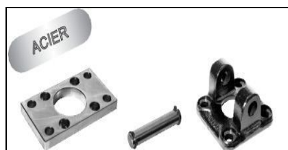
Plaque Axe Charnière