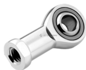
Embout à rotule