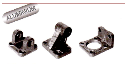
Charnière Femelle Charnière équerre